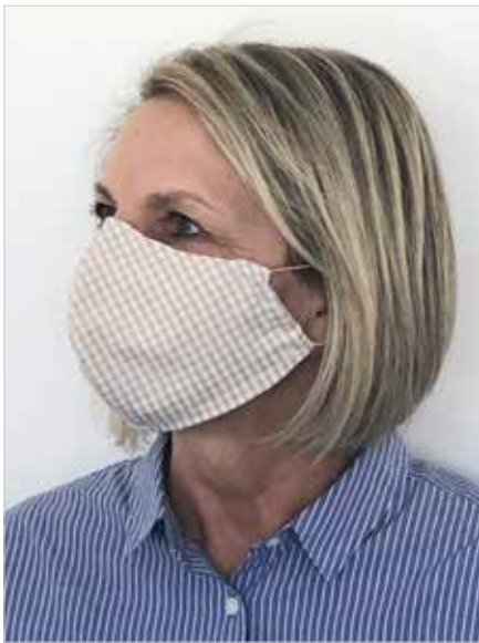
Abbildung zeigt Größe L